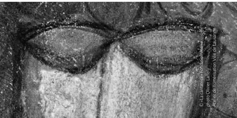
© «La cantatrice» Fondation Aloïse photo Olivier Laffey Atelier de numérisation Ville de Lausanne

Avec le partenariat de la HEM à Genève et autres à venir